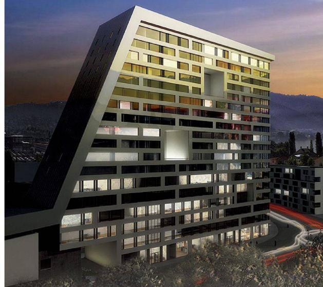
Hochhaus uptown in Zug Architektur: Schettlin-Syfrig+Partner Architekten AG, Luzern