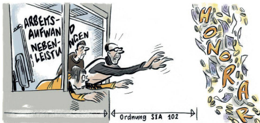
01 The missing link

Legt der Architekt die Berechnungsmethode seines Honorars im Vertrag nicht fest und ist er nicht imstande, den Zeitaufwand für seine erbrachten Leistungen nachzuweisen, verliert er das Recht auf sein Honorar. Dies belegt ein aktueller Bundesgerichtsentscheid.