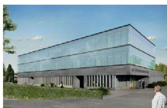
04 «Segmento» (Mozzatti Schlumpf): Labornutzung im flächigen Sockel