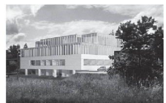
07 «Kirsch» (Osterhage Riesen): neuer Bautypus mit Zwillingkern