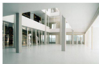
05 «Circulus» (Mazzapokora/HSSP): Atrium mit angegliedertem Kern