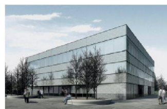
06 «Petri» (ARGE Heuberger Frey/Daniel Bünzli): sensible Einbettung