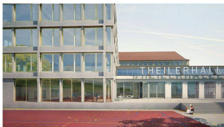
04 «Richard 1»: direkter Anbau (Meier Hug)

Bau, Luzern; SYTEK, Binningen; Bakus Bauphysik & Akustik, Zürich