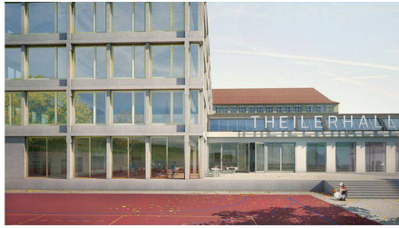
04 «Richard 1»: direkter Anbau (Meier Hug)

Bau, Luzern; SYTEK, Binningen; Bakus Bauphysik & Akustik, Zürich