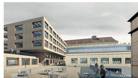
05 «Tegula»: gerade Schneise