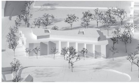
01 Weiterbearbeitung: «Espartogras», von Ballmoos Krucker Architekten

Von Ballmoos Krucker Architekten gewinnen den Wettbewerb für das Wohn- und Pflegezentrum Blumenrain.