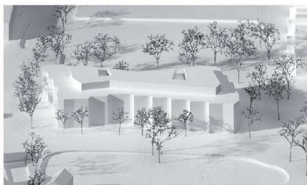
01 Weiterbearbeitung: «Espartogras», von Ballmoos Krucker Architekten

Von Ballmoos Krucker Architekten gewinnen den Wettbewerb für das Wohn- und Pflegezentrum Blumenrain.