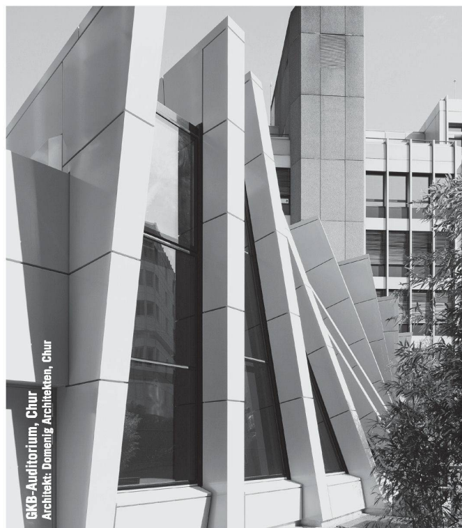
GKB-Auditorium, Chur Architekt: Domenig Architekten, Chur

Partner für anspruchsvolle Projekte in Stahl und Glas