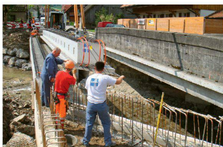
Montage erste Etappe mit bestehender Brücke daneben

Die Hauptverbindung von Wiggen nach Marbach überquert kurz vor Marbach den Schonbach. Die alte Brücke genügte den heutigen Anforderungen bezüglich Lichtraumprofil nicht mehr. Aufgrund der verkehrstechnischen Situation entschied der Bauherr, die Brücke unter Verkehr neu zu erstellen. In der ersten Etappe wurde die alte Brücke im Einbahnverkehr belassen. Die Träger zu dieser Etappe wurden im Sommer 2010 geliefert und montiert. Danach erfolgte der Überbau für die erste Etappe mit Schleppplatteln. Nach Fertigstellung der ersten Etappe wurde dieser Teil unter Verkehr genommen und die bestehende Brücke abgebrochen. Nach dem Aufbau der neuen Widerlager und des neuen Bachprofils konnten die vorgespannten Brückenträger der zweiten Etappe Ende September 2010 geliefert und versetzt werden.