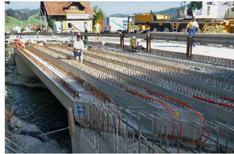
Montage zweite Etappe mit neuer Brücke der ersten Etappe für den Verkehr