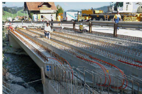
Montage zweite Etappe mit neuer Brücke der ersten Etappe für den Verkehr