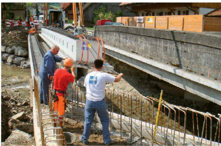
Montage erste Etappe mit bestehender Brücke daneben

Die Hauptverbindung von Wiggen nach Marbach überquert kurz vor Marbach den Schonbach. Die alte Brücke genügte den heutigen Anforderungen bezüglich Lichtraumprofil nicht mehr. Aufgrund der verkehrstechnischen Situation entschied der Bauherr, die Brücke unter Verkehr neu zu erstellen. In der ersten Etappe wurde die alte Brücke im Einbahnverkehr belassen. Die Träger zu dieser Etappe wurden im Sommer 2010 geliefert und montiert. Danach erfolgte der Überbau für die erste Etappe mit Schlepplatten. Nach Fertigstellung der ersten Etappe wurde dieser Teil unter Verkehr genommen und die bestehende Brücke abgebrochen. Nach dem Aufbau der neuen Widerlager und des neuen Bachprofils konnten die vorgespannten Brückenträger der zweiten Etappe Ende September 2010 geliefert und versetzt werden.