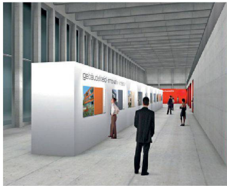
01 Visualisierung der Sonderschau

Themen der fünften «Appli-Tech», der Schweizer Leitmesse für das Maler- und Gipsergewerbe, für Trockenbau und Dämmung, sind Gebäudehüllen und Wohnraumklima. Vom 1. bis 3. Februar 2012 treffen bei der Messe Luzern die Planer und die Praktiker aus dem Maler- und Gipsergewerbe, dem Trockenbau und der Dämmung auf 150 Aussteller. Drei Sonderschauen befassen sich