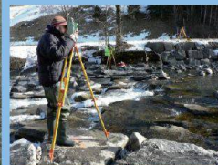
Vermessung der Gerinnesohle für hydraulische Berechnungen

Kostengünstige geophysikalische Voruntersuchung 3D Informationen für geologische Strukturen Beihilfe bei der Auslegung des seismischen Messnetzes