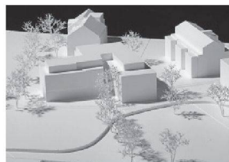
05 Neon-Bureau/Sina Buxtorf Arch.