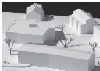
04 Kellenberger + Hirt Architekten