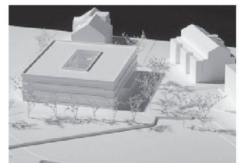
07 Ospelt Strehlau Architekten