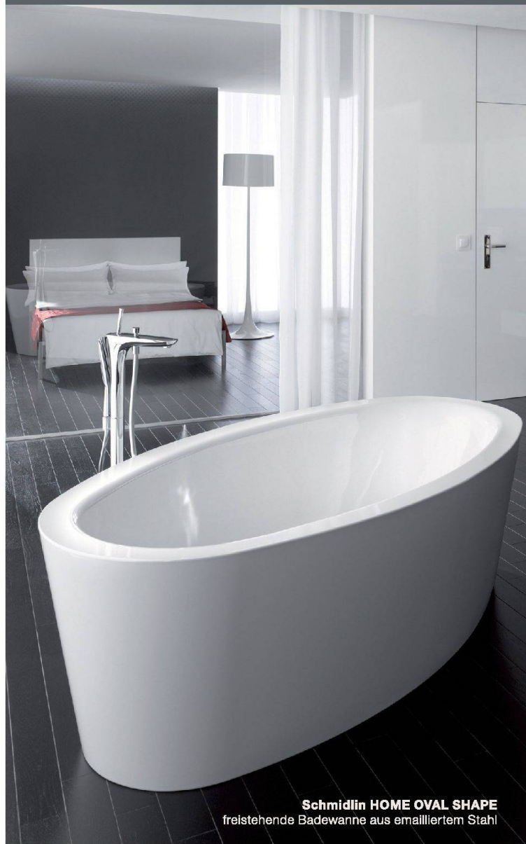
Schmidlin HOME OVAL SHAPE freistehende Badewanne aus emailliertem Stahl

Limmatstrasse 1 · 8957 Spreitenbach Tel. 056 419 77 11 · info@colores.ch