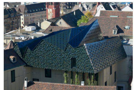
06 Anerkennung: Aufstockung auf dem Museum der Kulturen in Basel

15.9.–17.11.11, ETHZ Höggerberg, ARchENA