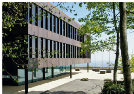
05 Anerkennung: Sanierung des Schulgebäudes in Magglingen BE