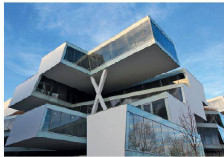
02 Auszeichnung: Verdreht gestapelte Fachwerk- und Vierendeelträger bilden das komplexe Hybridtragwerk des Business Center in Allschwil BL (vgl. TEC21 3-4/2010)

dem «Haus im Haus»-Prinzip zu einem Hörsaalgebäude umfunktioniert, und dabei wurden die ursprünglichen Stahlkonstruktionen der Fassade und des Tragwerks erhalten. Lobend erwähnt die Jury auch die Sanierung des Stahlbaus, den Max Schlup in den 1970er-Jahren für das Bundesamt für Sport in Magglingen errichtete. Der Stahlbau befand sich in ausgezeichnetem Zustand, sodass viele Originalbauteile erhalten werden konnten. Aktuelle Eingriffe setzen sich durch monochrome Oberflächen und die filigranere Detaillierung vom Bestand ab. Eine weitere Anerkennung erhält die unregelmässig gefaltete Dachkonstruktion zur Erweiterung des Museums der Kulturen in Basel, dessen moderne Stahlkonstruktion in den historischen Kontext passt.