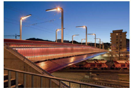
03 Auszeichnung: Die Langensandbrücke in Luzern spannt mit zwei Hohlkastenträgern im Verbund mit der Betonfahrbahnplatte 80 m stützenfrei über das Gleisfeld