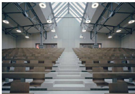
04 Anerkennung: Umnutzung der Weichenbauhalle in Bern

(af) Insgesamt 30 Projekte wurden zum diesjährigen Schweizer Stahlbaupreis eingereicht. Die Jury zeichnete drei Projekte mit dem Prix Acier 2011 aus und sprach acht weiteren eine Anerkennung aus. Neben der Auszeichnung für spektakuläre Bauten wie das Business Center in Allschwil (vgl. TEC21 3-4/2010) und der Anerkennung für das Learning Center EPFL (vgl. TEC2126/2010) wurden auch alltäglichere Bauwerke gewürdigt. Unter den Preisträgern befinden sich eine Sporthalle, drei Brücken und ein Autohaus. Eine Auszeichnung vergab die Jury für das Schutzdach im Kloster Saint-Maurice. Der von einer Felswand abgehängte Stahlrost schützt Ausgrabungen vor Steinschlag. Steine auf der Dachfläche wirken dem Windsog entgegen und absorbieren einen Teil der Aufprallenergie. Eine zweite Anerkennung wurde für die gelungene Umnutzung der ehemaligen Weichenbauhalle in Bern vergeben. Sie wurde nach