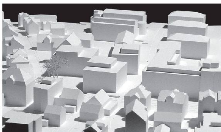
03 «Ring»