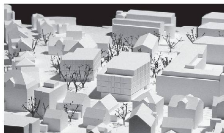
04 «Passeggiata»: zwei konische Bindeglieder