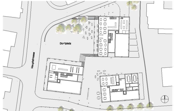
01+02 «Ring»: ein Grundstück – vier Quadranten, drei davon mit Gebäuden besetzt und einer als Platz freigehalten (Visualisierung + Plan: Verfassende)

Das Team Peter Luechinger Architektur/Fortimo Invest gewinnt den Investorenwettbewerb für die neue Zentrumsüberbauung in Goldach mit drei im Ortsbild verankerten Baukörpern.