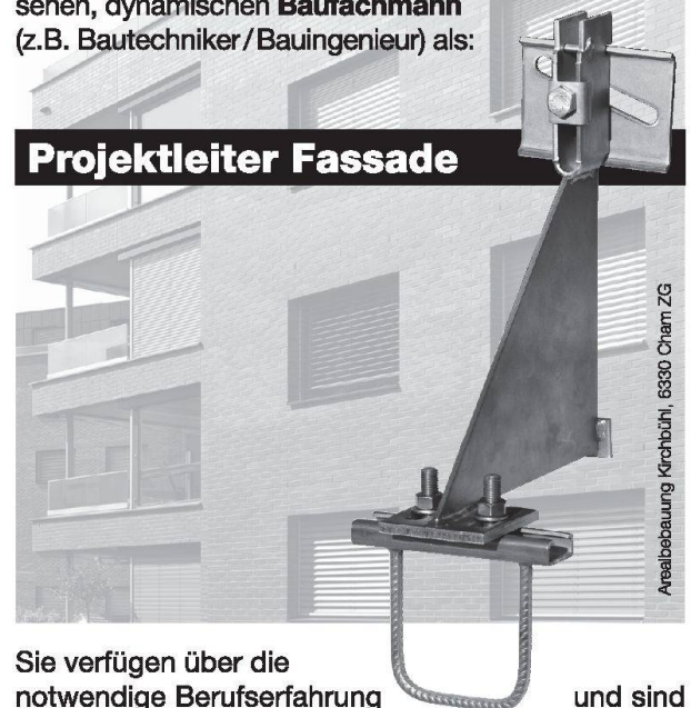
Areaalbebauung Kirschbühl, 6330 Chamm ZG

Sie verfügen über die notwendige Berufserfahrung und sind sich selbstständiges Arbeiten gewohnt. Auch unter Zeitdruck behalten Sie den Überblick. Teamfähigkeit, Verantwortungsbewusstsein, Flexibilität und schnelle Auffassungsgabe zeichnen Sie aus.