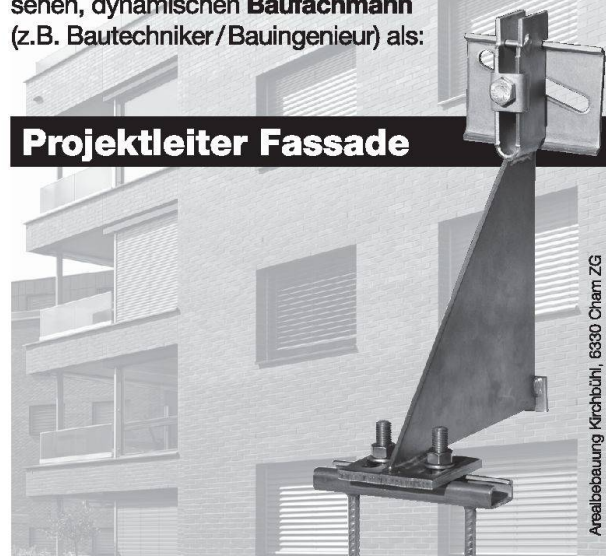
Arealbebauung Krieholzi, 6330 Cham ZG

Sie verfügen über die notwendige Berufserfahrung und sind sich selbstständiges Arbeiten gewohnt. Auch unter Zeitdruck behalten Sie den Überblick. Teamfähigkeit, Verantwortungsbewusstsein, Flexibilität und schnelle Auffassungsgabe zeichnen Sie aus.