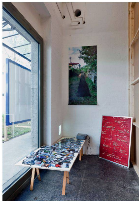
04 Erinnerungen an Charleroi: im Hintergrund das Plakat, das den neuen Zugang über die Gleise durch den Garten in die Wohnung zeigt