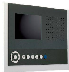
skyline plus UP

René Koch AG 8804 Au/Wädenswil 044 782 6000 info@kochag.ch www.kochag.ch