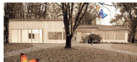
01-02 «Das doppelte Lottchen» (Freiluft Arch.)