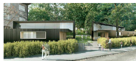
04 «Bürengarten» (ar3 Architekten)