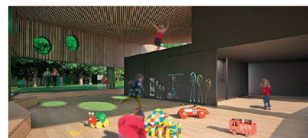
03 «Pinocchio» (0815 Architekten)