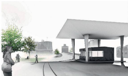
03 «Verbindender Knick» (zpf Ingenieure)