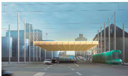
04 «VigKib Grenzenlos» (LOST Architekten)

Mit einem leuchtend weissen Ufo gewinnen Zickenheiner Architekten den Wettbewerb für die Zollstation der nach Weil am Rhein verlängerten Basler Tramlinie 8.