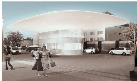
01-02 «Strahlend Weiss» (Zickenheiner Arch.)