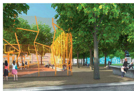
05+06 «Pyjama»: radikale Setzung, Spielbox «Schwitzkasten» für Jugendliche (Plan+Visualisierung: M. Oser, D. Baur, T. Beterams)

Im Rahmen des Evariste-Mertens-Preises 2010 hat der Bund Schweizer Landschaftsarchitekten und Landschaftsarchitektinnen (BSLA) einen Wettbewerb zur Aufwertung der Oekolampad-Anlage in Basel ausgeschrieben. Der Preis wird alle zwei Jahre an junge Schweizer Fachleute verliehen.