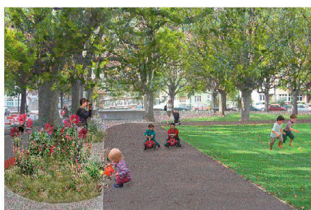
01+02 «Zwieback»: behutsame Aufwertung mit durchgehenden Bändern (Plan+Visualisierung: S. Gohl, A.-K. Läng)