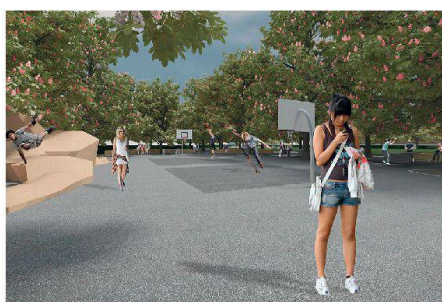
03+04 «Sophie»: sorgfältige Neuinterpretation, neue Baumhalle (Plan+Visualisierung: M. Karl, Th. Meitz, J. Menzel, D. Moshövel)