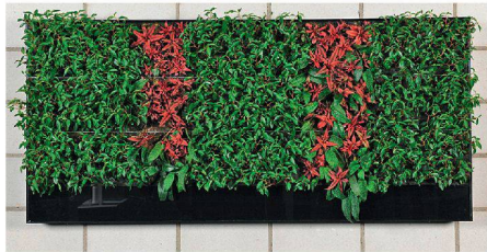
01 Grafisches Motiv mit Akzenten

Das Institut für Umwelt und natürliche Ressourcen der Zürcher Hochschule für Angewandte Wissenschaften (ZHAW) hat ein System für vertikale Innenraumbegrünungen entwickelt. Das Besondere: Das lebende Bild kommt ohne Pumpe, Wasser- und Stromanschluss aus.