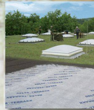
DELTA-TERRAXX Hochwertiges Schutz- und Drainagesystem

Wer optimale Flächendrainung und perfekten Grundmauerschutz anstrebt, kommt an den DELTA®-Noppenbahnen aus dem Hause Dörken nicht vorbei. Für alle Objekte im Hoch-, Tief- und Ingenieurbau bieten sie eine hohe Sicherheit vor Feuchtigkeit. Von der Standard- bis zur innovativen High-Tech-Anwendung: Das DELTA®-Noppenbahn-Programm ist so vielseitig wie Ihre Anforderungen. Die Dörken-Experten beraten Sie gern persönlich, welche Bahn für Ihr nächstes Projekt massgeschneidert ist. Vereinbaren Sie gleich einen Gesprächstermin!