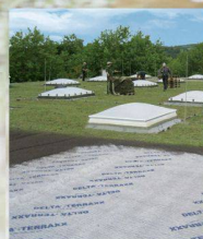
DELTA-TERRAXX Hochwertiges Schutz- und Drainagesystem

Wer optimale Flächendrainage und perfekten Grundmauerschutz anstrebt, kommt an den DELTA®-Noppenbahnen aus dem Hause Dörken nicht vorbei. Für alle Objekte im Hoch-, Tief- und Ingenieurbau bieten sie eine hohe Sicherheit vor Feuchtigkeit. Von der Standard- bis zur innovativen High-Tech-Anwendung: Das DELTA®-Noppenbahn-Programm ist so vielseitig wie Ihre Anforderungen. Die Dörken-Experten beraten Sie gern persönlich, welche Bahn für Ihr nächstes Projekt massgeschneidert ist. Vereinbaren Sie gleich einen Gesprächstermin!