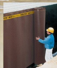
DELTA-MS Sauberkeitsschicht, Grundmauerschutz und Sickerschicht