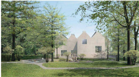
01 Siegerprojekt «Romina»

Die Zürcher Architekten Meier, Hug und Semadini gewinnen den offenen Projektwettbewerb für das neue Naturmuseum in St. Gallen.