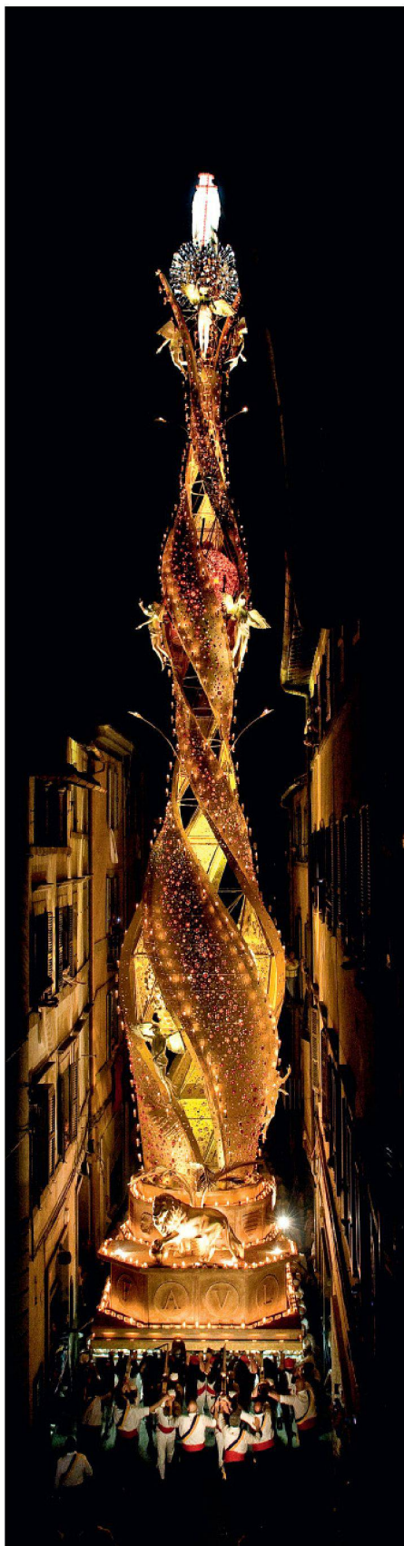
01 LED und Kerzen beleuchten «La Macchina di Santa Rosa»

Jedes Jahr tragen die Bewohner von Viterbo (I) ihre Stadtheilige Santa Rosa auf einer beeindruckenden Säule durch die Stadt. Die diesjährige, 30 m hohe Leichtbaukonstruktion verbindet traditionelle Kerzenbeleuchtung mit modernen LED.