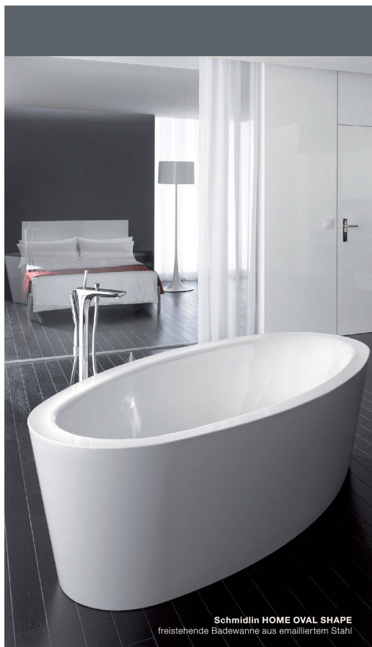
Schmidlin HOME OVAL SHAPE freistehende Badewanne aus emailliertem Stahl

Holcim (Schweiz) AG | 8050 Zürich www.holcim.ch/optimo