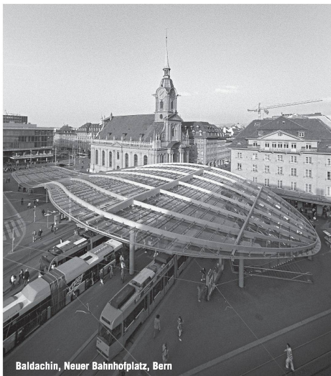
Baldachin, Neuer Bahnhofplatz, Bern

Partner für anspruchsvolle Projekte in Stahl und Glas