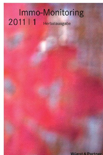
01 Cover Immo-Monitoring 2011/1

lung in sämtlichen Immobilienmarktsegmenten. Ein weiterer Abschnitt zeigt die Nachfragetrends im Wohnungsmarkt: Die Resultate stammen aus der zweijährlichen Immo-Barometer-Umfrage. Rund 1600 Haushalte aus der deutsch- und der französischsprachigen Schweiz wurden zu ihrer aktuellen Wohnsituation und allfälligen Veränderungsabsichten befragt. Die Kapitel 5 und 6 sind weiteren Thesen gewidmet, darunter die Auswirkungen von Gemeindefusionen auf Standortfaktoren oder der Zuzug internationaler Unternehmen. Zudem wird die Vielzahl der Nachhaltigkeitslabels thematisiert. Ein Vergleich stellt die Wichtigsten vor, wobei die Minergie-Zertifizierungen in einem eigenen Kapitel behandelt werden. Ein Immobilienatlas und diverse Markt- und Regionendaten sind ebenfalls enthalten. Das Nachschlagewerk bietet zudem einen Überblick über Trends im Wohn- und übrigen Hochbau mit Themen wie Tragkonstruktion, Fassaden oder Dachkonstruktion.