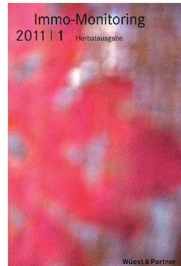
01 Cover Immo-Monitoring 2011/1

lung in sämtlichen Immobilienmarktsegmenten. Ein weiterer Abschnitt zeigt die Nachfragetrends im Wohnungsmarkt: Die Resultate stammen aus der zweijährlichen Immo-Barometer-Umfrage. Rund 1600 Haushalte aus der deutsch- und der französischsprachigen Schweiz wurden zu ihrer aktuellen Wohnsituation und allfälligen Veränderungsabsichten befragt. Die Kapitel 5 und 6 sind weiteren Thesen gewidmet, darunter die Auswirkungen von Gemeindefusionen auf Standortfaktoren oder der Zuzug internationaler Unternehmen. Zudem wird die Vielzahl der Nachhaltigkeitslabels thematisiert. Ein Vergleich stellt die Wichtigsten vor, wobei die Minergie-Zertifizierungen in einem eigenen Kapitel behandelt werden. Ein Immobilienatlas und diverse Markt- und Regionendaten sind ebenfalls enthalten. Das Nachschlagewerk bietet zudem einen Überblick über Trends im Wohn- und übrigen Hochbau mit Themen wie Tragkonstruktion, Fassaden oder Dachkonstruktion.