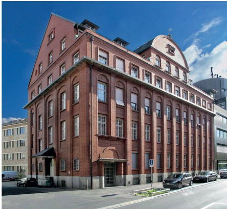
01 Die neue SBCZ

Nach 75 Jahren an der Ecke Talstrasse/Börsenstrasse hat die Schweizer Baumuster-Centrale Zürich (SBCZ) Ende September ihre neuen Räumlichkeiten im «Weberhaus» bezogen. Der Standortwechsel ist in vielerlei Hinsicht ein Glücksfall.