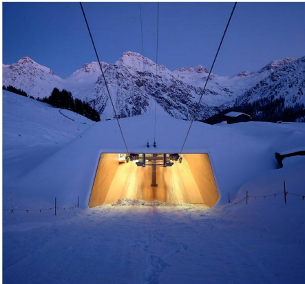
01 Sesselbahn Carmena in Arosa, Bearth & Deplazes Architekten

Unter dem Titel «Alpine Architektur und Tourismus: Quo vadis?» organisieren Seilbahnen Schweiz und der SIA am 5. November 2010 eine Tagung im Schweizerischen Alpen Museum in Bern. In Referaten und einer Podiumsdiskussion sollen die heutigen und zukünftigen Wechselwirkungen zwischen Architektur und Tourismus im alpinen Kontext aus unterschiedlicher Perspektive beleuchtet werden.