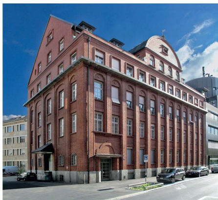
01 Die neue SBCZ (Foto: Nil + Hürzeler)

Nach 75 Jahren an der Ecke Talstrasse/Börsenstrasse hat die Schweizer Baumuster-Centrale Zürich (SBCZ) Ende September ihre neuen Räumlichkeiten im «Weberhaus» bezogen. Der Standortwechsel ist in vielerlei Hinsicht ein Glücksfall.