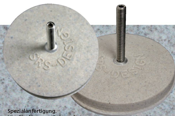
Spezialanfertigung. Nivellierfüsse aus Polymerbeton für den Holzrostbau.

Mit diesem zukunftsweisenden Werkstoff aus Polyester und Quarzsand lassen sich Teile für die unterschiedlichsten Anwendungen formen und herstellen. 100% wasserdicht, feuer- und säurebeständig und mit einer sehr hohen Biegezugfestigkeit lässt der Werkstoff Polymerbeton minimale Wandstärken von 3 cm zu.