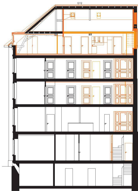
03 Querschnitt (Pläne: Architekten)