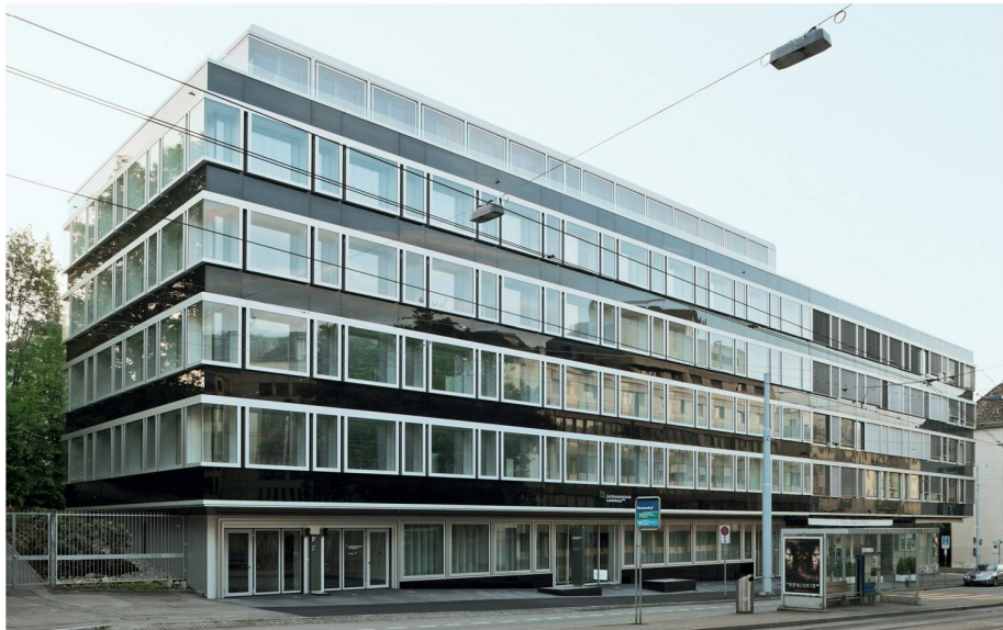
01 Zwei Generationen Glasfassaden

An der Stampfenbachstrasse in Zürich Unterstrass hat Max Dudler ein Bürohaus von 1971 umgebaut. Blickfang ist die in zeitgenössische Architektursprache übersetzte Weiterentwicklung der bestehenden Fassade.