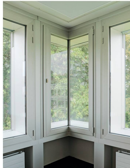
02 Das Eckfenster löst die Gebäudeecke im Inneren auf

Dieser Aufbau dient neben den klimatischen Erfordernissen auch der Akustik: Die Geräuschkulisse von Autos und Tram ist im Inneren nur sehr gedämpft wahrzunehmen. Neben der Fassade wurden auch der Eingangsbereich, die Erschliessung mit Treppenhaus und Lift sowie die Erweiterung der Tiefgarage von Max Dudler neu gestaltet.