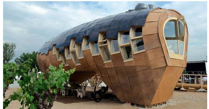
07 17. Rang (583 Punkte) / Publikumsliebbling: FABLAB House

einfacher zu bedienen sein und gleichzeitig in den Kosten sinken – das ganze Gepäck muss wieder handlicher werden.