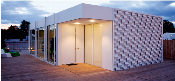
02 2. Rang (811 Punkte): IKAROS