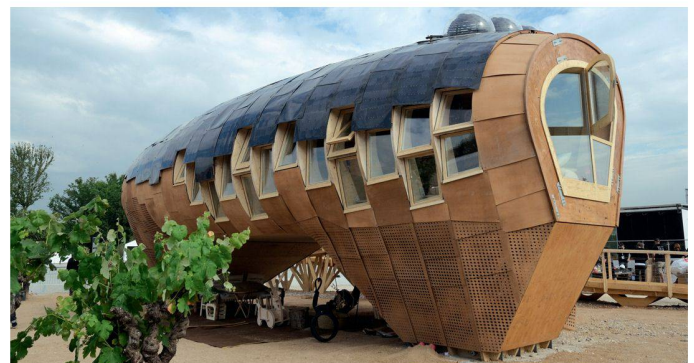
07 17. Rang (583 Punkte) / Publikumsliebbling: FABLAB House

einfacher zu bedienen sein und gleichzeitig in den Kosten sinken – das ganze Gepäck muss wieder handlicher werden.