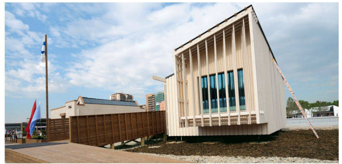
05 5. Rang (777 Punkte): Luukku-Holzhaus