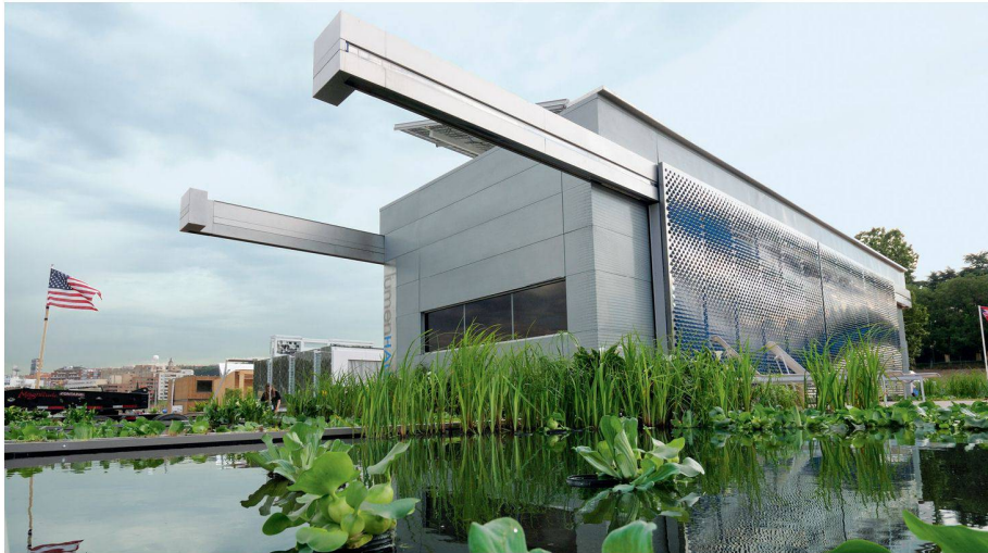
01 1. Rang (812 Punkte): Lumenhaus

Mitte Juni machten sich 17 Hochschulen auf eine Reise nach Madrid. Im Gepäck hatten sie ihre Vision vom solaren Wohnen: Sie brachten jeweils ein Haus mit, vorgebaut und in Containern verpackt. Die Hochschulen folgten einer Einladung des spanischen Wohnungsbauministeriums zum Solar Decathlon Europe.