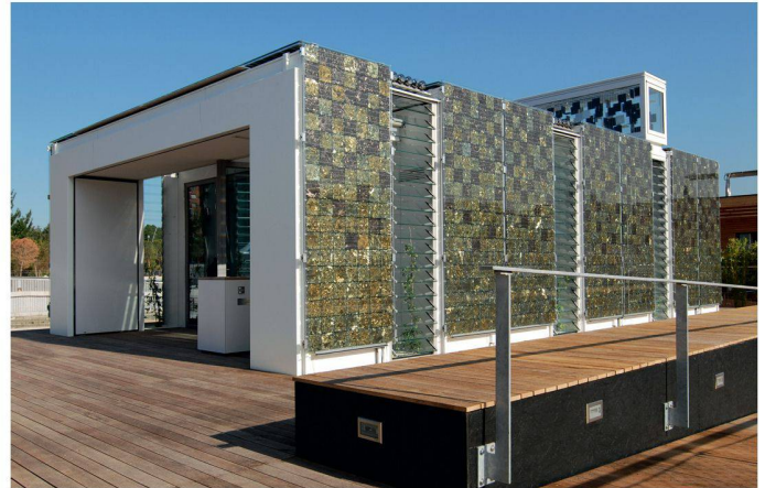
03 3. Rang (807 Punkte): Home+