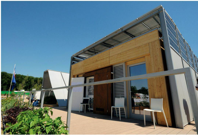
04 4. Rang (794 Punkte): Armadillo Box