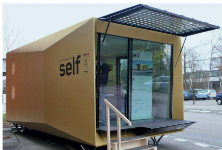
01 «Self» erprobt eine Reihe neuer Technologien im Praxiseinsatz

An der Swissbau wurde die Raumzelle «Self» vorgestellt: Sie versorgt sich selbst mit Energie und Wasser und bietet zwei Personen ohne grössere Komforteinschränkung Platz zum Leben und Arbeiten.