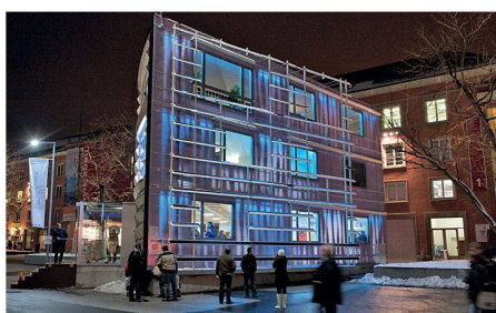
01 «Woodstock» zeigt, dass sich Buchenholz auch als Baustoff eignet

Auf dem Basler Messeplatz stand für die Swissbau ein Prototyp eines dreigeschossigen, klimafreundlichen Hauses, dessen Tragkonstruktion aus einheimischer Buche gefertigt ist. Das Bundesamt für Umwelt hat das Projekt namens «Woodstock» massgeblich unterstützt.