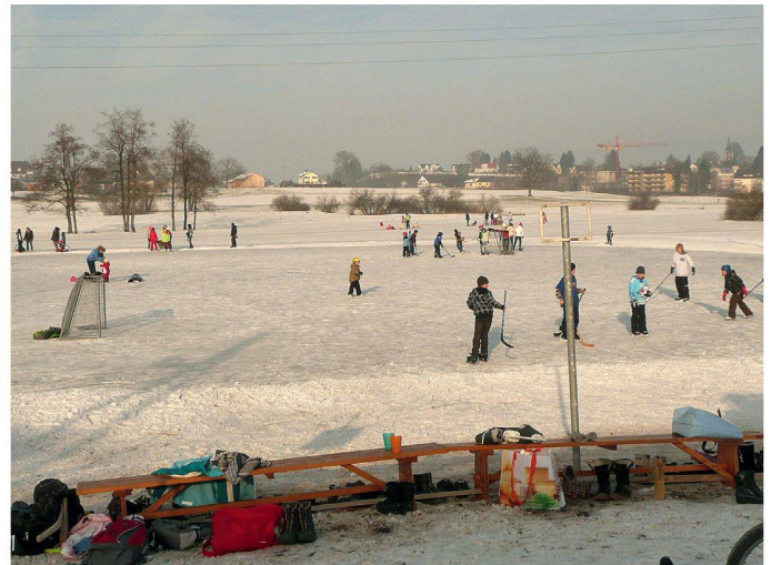
02 Eine gemeinsame Identifikation der Agglomerationsbevölkerung mit dem Siedlungsraum der «S5-Stadt» existiert nicht. Nur die Naturräume wie hier das «Hüsliriet» bei Bubikon könnten eine identitätsstiftende Klammer bilden

Ein grosser Teil der Schweizer Bevölkerung lebt heute in Agglomerationen. Wie sollen diese nach wie vor stark wachsenden Gebiete gestaltet werden, damit es sich dort gut leben lässt? Dieser Frage ging das Forschungsprojekt «Stand der Dinge – Leben in der «S5-Stadt»» am Beispiel des Lebensraumes entlang der Bahnlinie S5 zwischen Zürich und Pfäffikon SZ nach. Das hier vorgestellte Teilprojekt befasste sich mit der Bedeutung der Naturräume.