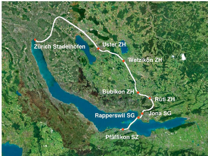
01 «S5-Stadt»: Der Bau der S5 gilt als einer der grundlegenden Faktoren für die rasche räumliche Entwicklung dieser Region. Mittlerweile verdichtet die S15 den Takt auf dieser Strecke (Plan: ETH Wohnforum – ETH CASE)