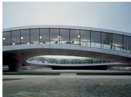
01 Einer der Schwerpunkte am Betontag: Rolex Learning Center EPFL (SANAA © Hisao Suzuki)

(pd) Am 1. September 2010 findet der Betontag der Fédération Internationale du béton (fib) an der EPF Lausanne statt. Die fib ist die einzige weltumfassende Fachvereinigung, die sich mit sämtlichen Aspekten des Betonbaus befasst. Eines ihrer Hauptziele ist die Verbreitung der neusten Entwicklungen im Betonbau. Anhand von Schweizer Leuchtturmprojekten wie dem Rolex Learning Center der EPFL, dem Zürcher Prime Tower oder dem Besucherzentrum im Nationalpark Zernez werden neuste Materialienanwendungen und Konstruktionsmethoden vorgestellt. Anlässlich des Kongresses, der alle vier Jahre stattfindet, wird auch die neue Publikation zu herausragenden Leistungen im Schweizer