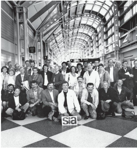
01 Aus dem Archiv: Reise nach Chicago 1989

(a&k) Vor 40 Jahren formulierte eine Gruppe um die Architekten Willy Althaus und Ulyss Strasser in Bern die Ziele einer Gruppe für «Architektur und Bauwesen» innerhalb des SIA. Die Fachgruppe für Architektur, die am 4. Juni 1970 von 250 Architekten im Kursaal in Bern gegründet wurde, sollte zu einer starken Brücke zwischen dem Verwaltungsapparat des Vereins und dem Berufsalltag der Architekten werden. Mit der Neuaufrichtung des SIA im Jahr 2000 wurde die Fachgruppe für Architektur in «SIA Fachverein für Architektur und Kultur» umbenannt und die Zielsetzung entsprechend angepasst.