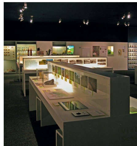
01 Verschiedene Stationen der Ausstellung laden die Besuchenden ein, sich interaktiv zu betätigen

Am Beispiel der Kartoffel wird verdeutlicht, dass uns die Artenvielfalt – bzw. deren Schwund – im täglichen Leben begegnet: Gab es Anfang des 20. Jahrhunderts in der Schweiz rund 250 verschiedene Kartoffelsorten, so sind es heute nur noch knapp 30. Neben der verlorenen Vielfalt auf unserem Speiseplan birgt dieser Rückgang auch ein Risiko für den Fortbestand der Art. Denn Vielfalt ist eine Art Lebensversicherung bei sich ändernden Umweltbedingungen, seien es ein Schädlingsbefall oder klimatische Veränderungen. Konzipiert wurde die Ausstellung vom Forum Biodiversität und den Naturhistorischen Museen Bern und Genf.