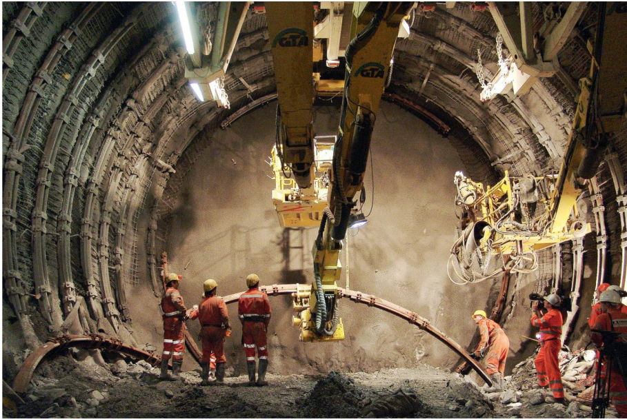
01 Einbau von Stahlbogen an der Tunnelbrüst bei Sedrun

Bereits zum neunten Mal fand vom 9. bis 11. Juni der Swiss Tunnel Congress (STC) der Fachgruppe für Untertagebau (FGU) statt. Der Anlass, der sich zunehmender internationaler Aufmerksamkeit erfreut, konnte gleich mit einer erfreulichen Botschaft eröffnet werden: Die Kandidatur der FGU für den World Tunnel Congress 2013 war erfolgreich. Der wichtigste internationale Treffpunkt für Tunnelbauer wird in drei Jahren somit erstmals in Genf stattfinden.