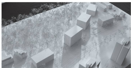
06 «Plural»: Fünf kompakte Kuben