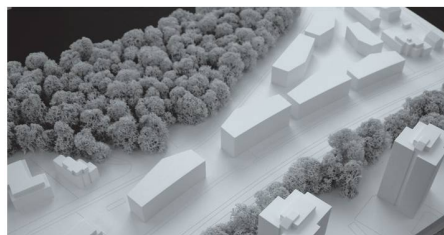
04 «riri»: Sieben fünfeckige Gebäude