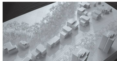
05 «Lionel»: Acht Stadtvillen