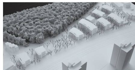
08 «Epizentrum»: Neun radiale Zeilenbauten