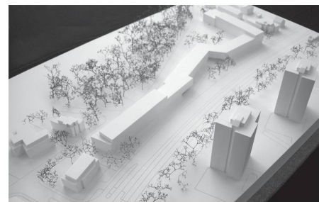
01 + 02 Siegerprojekt «Long John»: 250 Meter Wohnen (Visualisierung: sabarchitekten)

In Reinach BL sollen Wohnungen für Doppelverdiener, Familien mit Kindern und Einzelpersonen entstehen. Das Projekt von sabarchitekten mit einem 250m langen, kubisch gegliederten Baukörper als Pendant zu drei benachbarten Hochhäusern soll weiterbearbeitet werden.