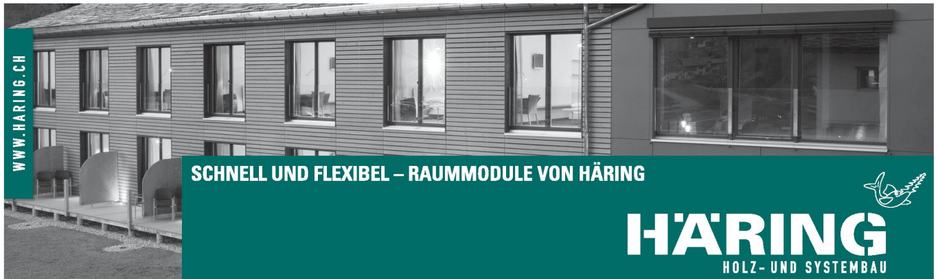
Hotelmodulbau_Hotel Rovanada Vals/GR

CH-4133 Pratteln/BL, tel. +41 (0)61 826 86 86