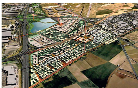
01 Masterplan für das 850 ha grosse Gebiet «Triangle de Gonesse» zwischen den Flughäfen Charles de Gaulle und Le Bourget in Paris (Visualisierung: Güller Güller architecture urbanism)

(af) Die Airport Regions Conference (ARC) verlieh im Dezember anlässlich ihrer Konfe-