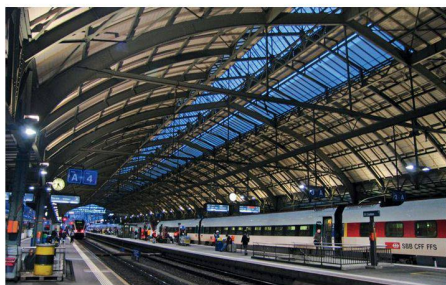
01 Perronhalle Bahnhof St. Gallen: Eine gezielt asymmetrische Lichtführung unterstützt die Raumwirkung der historischen Bahnhofshalle (Foto: Architekten-Kollektiv, Winterthur)

Drei Lichtplanungen in sehr unterschiedlichen Raumsituationen erhielten den mit insgesamt 15 000 Franken dotierten Prix Lumière 2009.