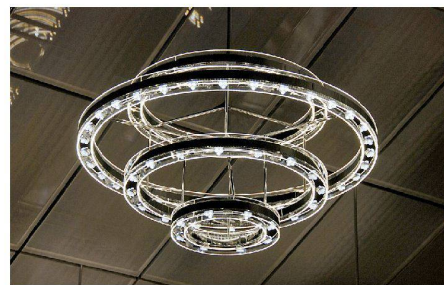
03 Konferenzraum im Parlamentsgebäude, Bern: Die Neuinterpretation des Kronleuchters ermöglicht, verschiedene Lichtsituationen zu erzeugen

während der Rest die Bogenkonstruktion gleichmässig beleuchtet. So entsteht ein für Passagiere und Zugführer blendfreies und sicheres Ambiente, das zugleich die Raumwirkung erlebbar macht. Wesentlich kleiner ist hingegen der Kirchenraum der fünfzig Jahre alten Zwinglikirche in Schaffhausen. Die für die Sanierung erarbeitete Lösung mit frei angeordneten Einbauleuchten und einer beispielbaren Lichtwand setzte die Jury auf den zweiten Platz. Den dritten Platz erreichten die modernen Kronleuchter im neuen Konferenzsaal über dem Ständerat. Jeder der sechs Leuchter besteht aus vier Acrylglasringen und ist mit LED-Technik ausgestattet, die eng, breit und diffus strahlen können. Statt wie bisher alle drei Jahre soll der Prix Lumière das nächste Mal bereits 2011 verliehen werden.