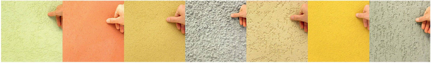
01 Eine der neusten Perlen der SBCZ: vielfältige Oberflächenbehandlungen zur Konkretisierung und Inspiration

Seit März 2010 sind die Materialmuster der Schweizer Baumuster-Centrale Zürich (SBCZ) mit den Materialtexturen auf der Datenbank «mtextur.com» vernetzt. Zusätzlich bietet die SBCZ neu einen Recherchedienst an. Mit den neuen Dienstleistungen kann ein wichtiger Beitrag an die Überprüfbarkeit und Konkretisierung von Entwurfsgedanken geleistet werden: weg von virtueller Effekthascherei, hin zu einem realitätsnahen Ideenaustausch.