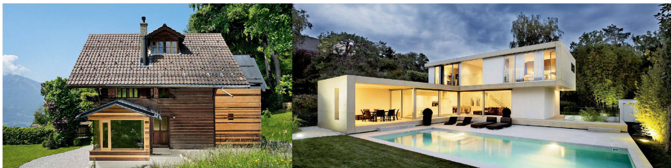
03 Chalet Noisette, Gryon (VD), Iacroy | chessex 04 Villa S, Bellevue (GE), group8