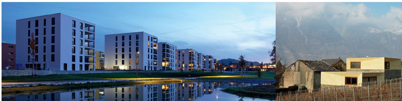
01 Dreispitz, Bern Liebefeld (BE), Rykart Architekten AG 02 Transformation, Charrat (VS), clavirossier