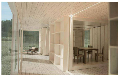
01 «inter pares»: verschiebbare Raumelemente