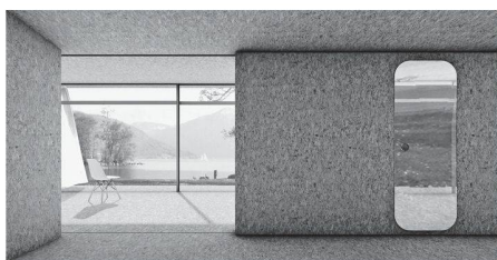
03 «Tosca»: zentrale Schiebewand – drei Räume

Beim ersten Hawa Student Award ging es darum, die Möglichkeiten des Schiebens auszuloten – unter dem Thema «Das wandelbare Haus» machte sich der Gestalternachwuchs Gedanken.