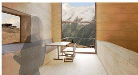
02 «Plan B»: flexible Geschossdecken