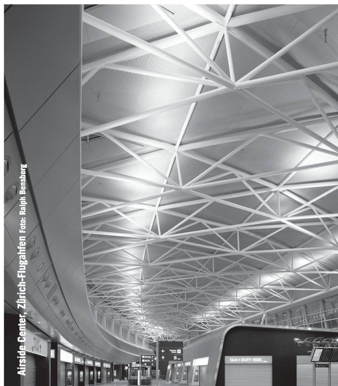
Airside Center, Zürich-Flughafen

BASYS AG | Industrie Neuhoof 33 | 3422 Kirchberg | Tel. 034 448 23 23