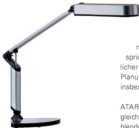
„Die neue Waldmann Schreibtischleuchte MAIA. Funktionale Lichtkultur mit ausgeprägter Energieeffizienz. Mit integrierter AMBIO-Entblendungstechnologie. Hoher Bedienkomfort.“

Die neue Schreibtischleuchte MAIA zeigt eine Vielzahl herausragender Güteigenschaften. Ästhetik, Ergonomie, Lichtqualität und Lichteffizienz sind mit dieser Neuschöpfung in einzigartiger Weise verknüpft.