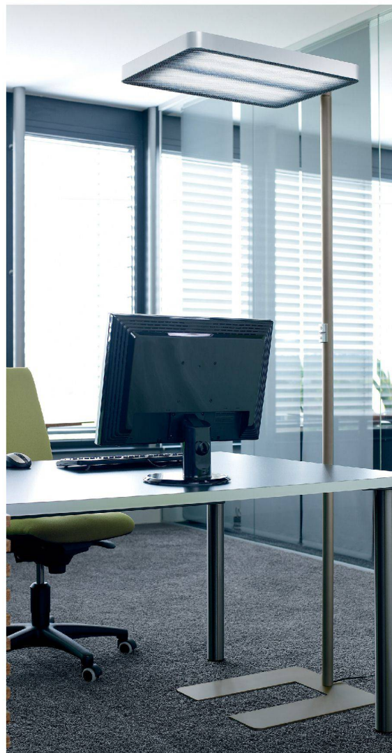
Die neue Indirektleuchte ATARO verbindet intelligente Lichttechnik mit Ästhetik und Komfort. Hohe Energieeffizienz

ATARO und MAIA sind gleichermaßen mit der neuen Entblendungstechnologie AMBIO ausgestattet. AMBIO ist eine Prismenscheibe aus eingefärbtem PMMA (Polymethylmethacrylat) mit sehr hoher Lichtdurchlässigkeit. Die Oberfläche besteht aus zahlreichen Mikroprismen, die computergestützt berechnet und geformt sind. Dadurch wird eine vollkommen gleichmäßige Rundumblendung und gleichzeitig höchste Lichtausbeute erreicht.