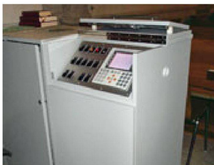
01 Universelle Steuer- und Regelungstechnik für Kirchen

Der Unterhalt von Kirchen unterscheidet sich von dem anderer Gebäude hinsichtlich der heizungstechnischen Anlagen und in Bezug auf den Heizbetrieb, zudem werden spezielle Anforderungen an das Raumklima gestellt. Ein grosses Energiesparpotenzial liegt dabei in betrieblichen und regelungstechnischen Massnahmen.