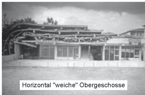
Horizontal "weiche" Obergeschosse