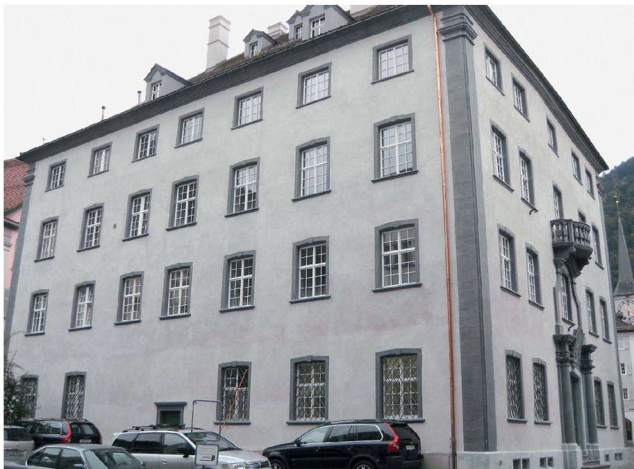
01 Ecke Nordwestfassade des Bündner Regierungsgebäudes in Chur