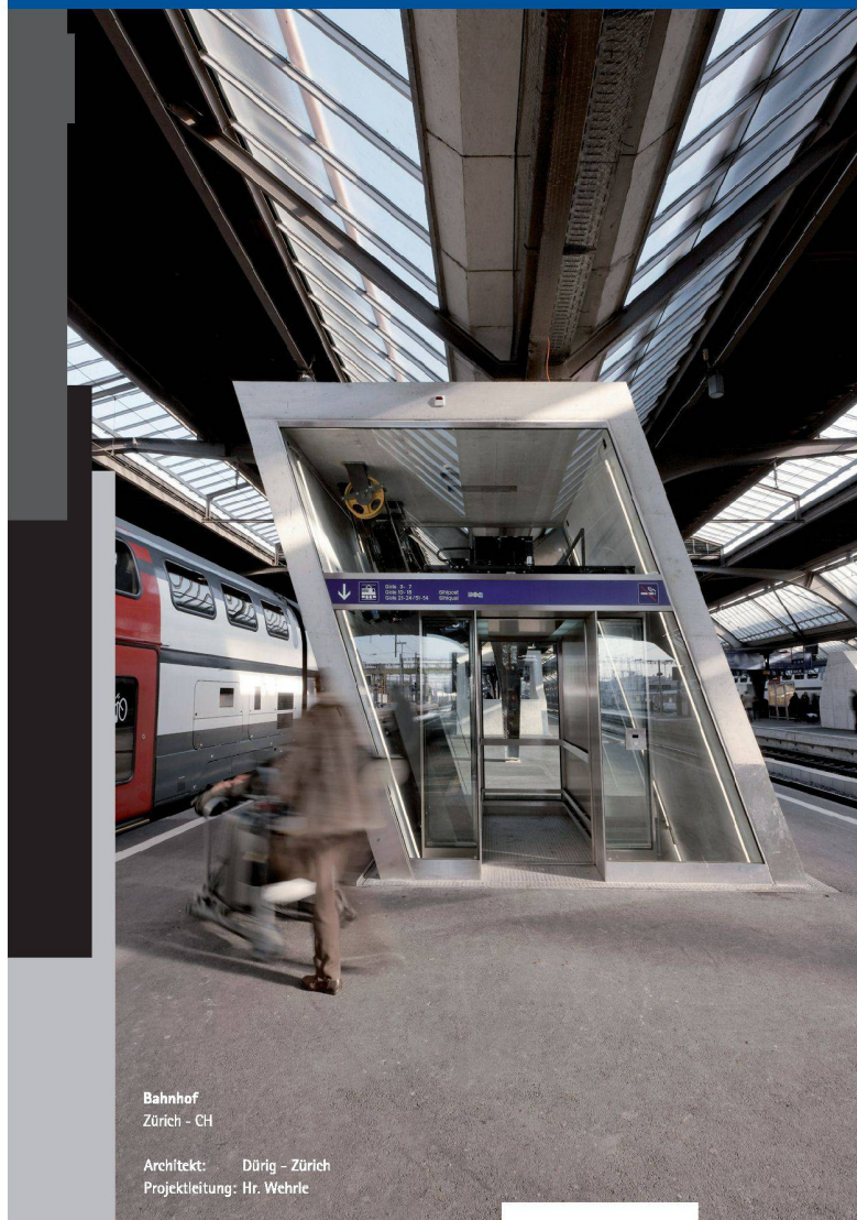
Bahnhof Zürich - CH

Das zeigt sich gerade bei architektonisch und kon- zeptionell anspruchsvollen Projekten. Wir setzen Ihre Vision um.