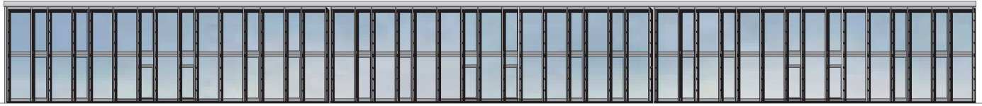
03 Wettbewerbsprojekt: neue Fassade des Klassentraktes (Bild: Jürg Graser)

möglichen Haltungen – entweder die bestehende Glasfassade nach denkmalpflegerischen Grundsätzen zu erhalten oder eine Neuinterpretation derselben vorzuschlagen. Mit der oben zitierten Aussage Fritz Hallers im Hinterkopf kam für uns von vornherein nur eine Neuauslegung in Frage. 2