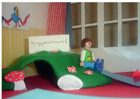
03 «Kita»