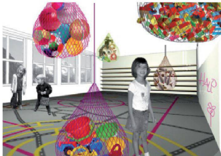
01 Siegerprojekt «Spielbox» (Visualisierung: Heike Heldt)