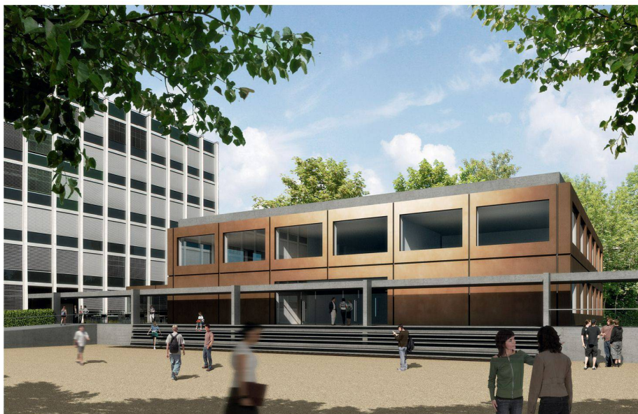
03 Grossformatige Fassadenelemente aus Bronze und Schaufenster prägen den Erweiterungsbau

Nach dem Umbau der Aula im Jahr 2005 dürfen Felber Widmer Kim Architekten erneut Hand an die Berufsschule Aarau legen. Nach der Überarbeitung konnten sie sich im Studienauftrag gegen e2a Eckert Eckert Architekten durchsetzen.